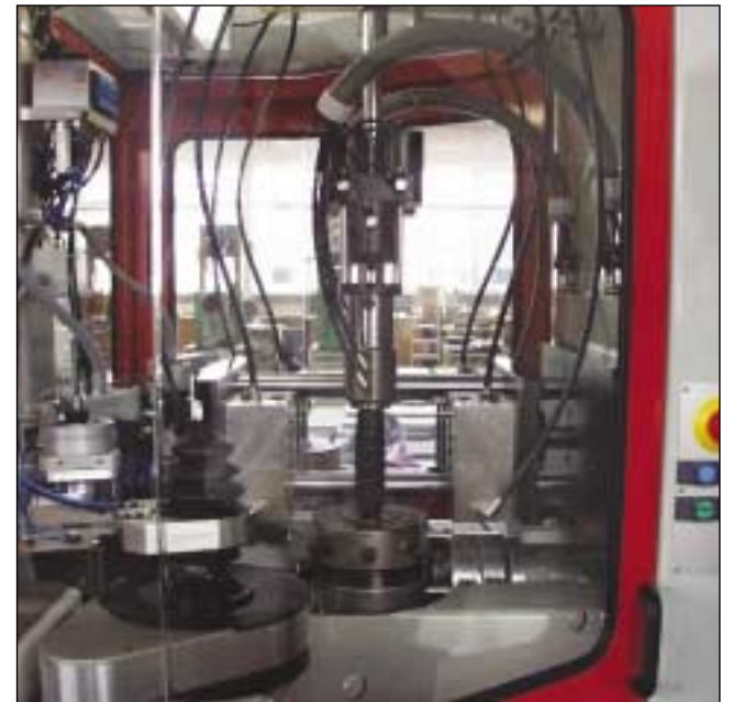
Das Automatikprogramm für das Spritzblasen läuft in vier Takten ab: Spritzwerkzeug positionieren und Kopfteil spritzen, Vorformling wandstärken- und geschwindigkeitsgerecht pressziehen, Hohlkörper blasen und Bodenrest abschneiden

Über den ersten CAN-Bus ist das Modul mit der Ablaufsteuerungs-CPU Typ PU103 (mit zwei seriellen Schnittstellen für die Waagen), den drei Multitemperaturreglern Typ KS800 und dem Industrie-PC mit 15-Zoll-Touchscreen zur Bedienung und Visualisierung verbunden. An den zweiten CAN-Bus sind sechs Ultraschall-Wegaufnehmer angeschlossen. Die Druck- und Dehnungsfühler sind direkt analog verbunden, ebenfalls alle Proportional- und Servoventile. Das DC150 liefert auch die Istwerte der Profile der partiellen Wanddicke, der Ziehein-