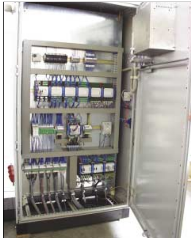
Im Schaltschrank-Zentrum befindet sich das Regelmodul DC150, darüber die Ablaufsteuerungsmodule, darunter die drei Multitemperaturregler KS800 und in der Tür der Industrie-PC

heit- und Spritzkolbenbewegung zur grafischen Darstellung mit den Sollkurven auf dem TFT-Bildschirm. Über eine Ethernet-Karte im IPC-Terminal IQT705 wird die Maschine direkt an das Firmennetzwerk angeschlossen.