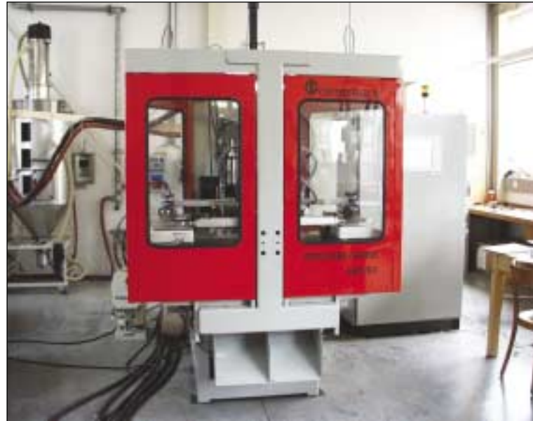
Doppel-Spritzblasmaschine SB2/60 von Ossberger: Damit lassen sich zwei komplexe Teile vollautomatisch fertigen

Besonders komplex ist die Maschinen- und Verfahrenstechnik der Spritzblasmaschinen, auf denen z.B. die Man-