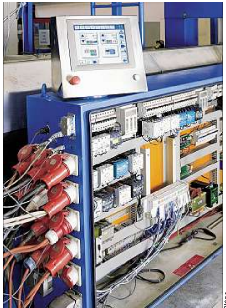
Umgerüsteter Schaltschrank mit varioEC und 12"-Bedienterminal.

der Euromap in Kooperation mit CiA-CAN in Automation)