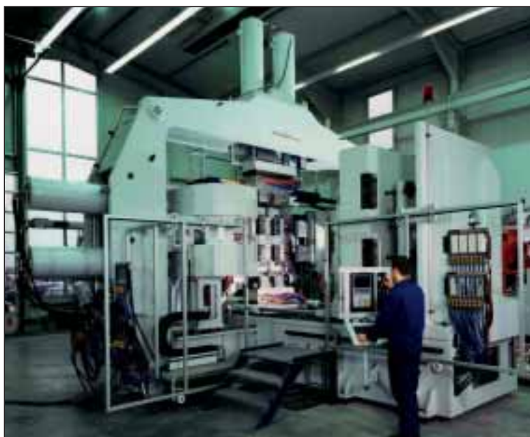
I SRM-3000-Spritzgießmaschine zur Herstellung von Schwerlastpaletten aus Kunststoff von Ettlinger

Damit eine moderne Spritzgießmaschine für Mikroteile oder Schwerlastpaletten zuverlässig arbeitet, sind mehrere hundert Parameter einzustellen. Ziel des Maschinenbauers ist es deshalb, die Bedienung der Anlage so übersichtlich und einfach wie möglich zu gestalten. Moderne regelungstechnische Komponenten in Kombination mit Industrie-PCs und Touchscreens ermöglichen solche ergonomischen Lösungen.