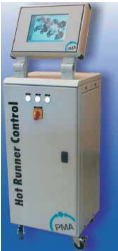
4 Heißkanalregler HRC 800: über 160 Temperaturzonen per Fingertipp im Griff

die Druckverläufe (Hydraulik- oder Forminnendruck) wahlweise über den Einspritzweg oder die Zeit dargestellt. Mit Hilfe von Cursor und Lupenfunktionen lassen sich „mit dem Finger auf der Kurve“ die Verläufe analysieren und insbesondere das Verhalten in der Kompressionsphase erkennen. Das Beispiel der hochkomplexen Spritzblasmachine zeigt die synchronisierten Profilvorgaben für den Einspritzkolben, die Düsen und die Zieheinheit die Leistungsfähigkeit der Touchscreen-Technik. Dabei übertragen Kopierfunktionen selbst komplexe Kurven auf eine zweite Düse. Durch die Einspielung des Istwertverlaufes direkt in diese Sollkurvenverläufe erkennt der Maschinenfahrer Abweichungen oder sieht den reproduzierbaren Vorgang bestätigt, bevor das Produkt auf der Waage überprüft wird. Blockschaltbilder zeigen die Vorteile der Standardtechnik wie IPC mit Windows bei der Einbindung über Ethernet-Netzwerke in das firmeninterne Intranet und damit die mögliche Freigabe für Internet-Support-Funktionen. Handelsübli-