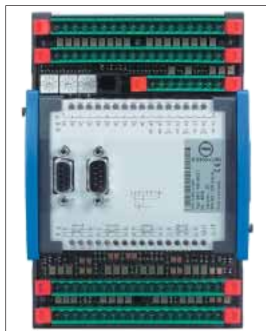
3 Multitemperaturreglermodul KS 800 von PMA: Diese autarken Multitemperaturregler entlasten den IPC von Echtzeitaufgaben

Diese wenigen Seiten des Touchscreens zeigen die übersichtliche Vorgabe von wenigen Parametern für die freizügig einstellbaren Einspritzgeschwindigkeits- und Nachdruckprofile sowie die deutliche Kennzeichnung des eingetretenen Umschaltkriteriums. Auf einer hochauflösenden Istwertgrafik werden