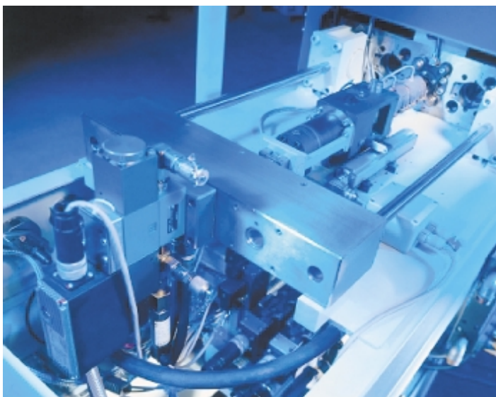
Ein Blick in die Einspritzeinheit der D-I-M-Maschine

Dazu werden autarke Funktionsmodule des Systems P-open für die Prozeßaufgaben eingesetzt, die über den Feldbus CAN mit dem Protokoll CANopen untereinander und mit den Wegsensoren sowie dem Bedienterminal, einem Industrie-PC, kommunizieren. Dadurch belasten Erweiterungen der Regelkreise für die Heißkanal-Temperaturen oder weitere Spritzaggregate nicht den zentralen Bedien-PC, sondern es bleibt ein zuverlässiges und schnelles Real-time