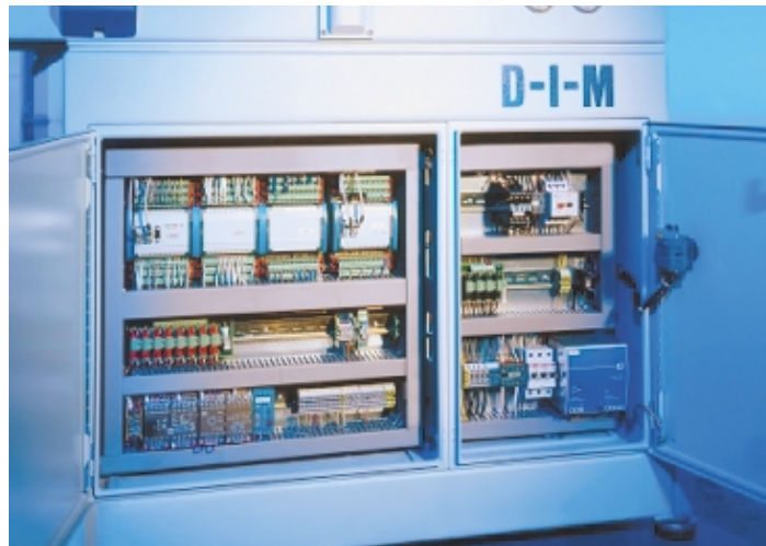
Sauber und aufgeräumt ist der Schalterschrank der Maschine

Das Bedienterminal läuft mit einem Standard-Windows-Betriebssystem und läßt sich so einfach mit aus der Bürowelt bekannten Softwarepaketen erweitern (zum Beispiel für Datenarchivierung, SPC etc.). Preiswert und standardmäßig wird der eingesetzte Industrie PC mit größeren Speichermodulen oder Netzwerkkarten und Modems ergänzt. Damit sind weltweit getestete Softwarepakete für die Anbindung an firmeninterne Netzwerke und die Ferndiagnose über Telefonmodem und Internet schnell und preiswert nutzbar. Dadurch kann der Maschinenanwender den Support von Fachleuten auf der ganzen Welt auf direktem Wege nut-